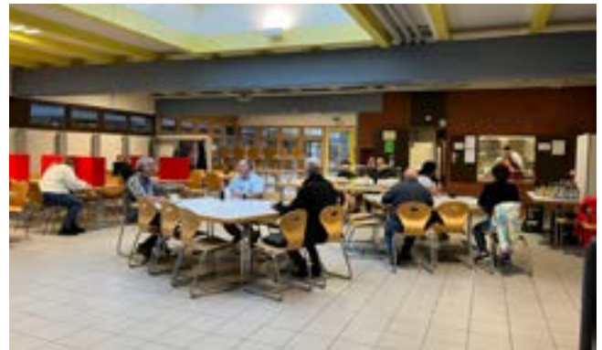
Nach der Blutspende