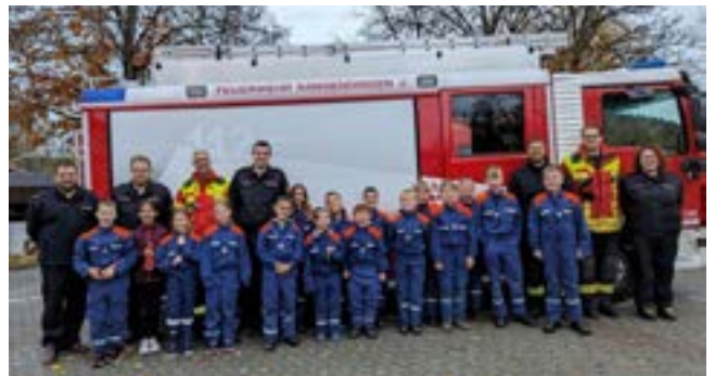
Die Gruppe 2