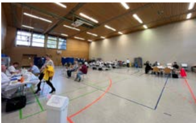
Während der Blutspende

Hiermit möchten wir uns ganz herzlich bei allen SpenderInnen und HelferInnen der letzten Blutspende bedanken. Bitte macht weiter so.