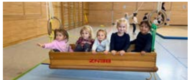
Schaukeln - die Schwerkraft erleben