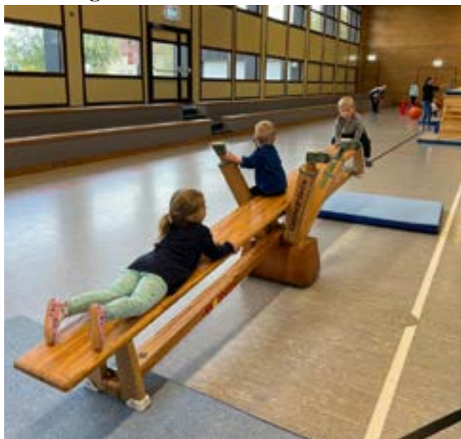
Balancieren und Wippen - das Gleichgewicht schulen