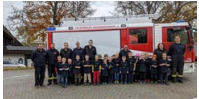
Die Gruppe 1