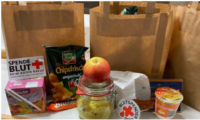
Unsere lecker Vespertüte für alle SpenderInnen und HelferInnen