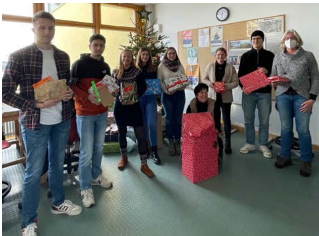
Die Geschenke des BSZ für hilfsbedürftige Kinder - leuchtende Augen garantiert