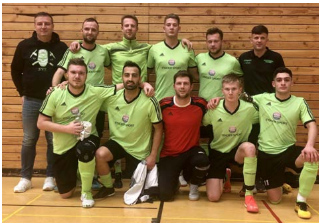
Mannschaftsfoto (nicht alle SVR Spieler sind mit auf dem Bild)

Für alle beteiligten waren diese 3 Tage Turnier ganz sicher unvergesslich. Vielen Dank an dieser Stelle auch an die Fans und Spieler vom SV Stetten. Das war ein großartiges Miteinander. Fußball verbindet eben !!!!