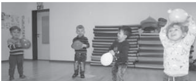
Herr Hoch und Frau Tief - Mitmachgeschichte mit Luftballon

Bald können sie jeden Tag verkleidet in den Kindergarten kommen und sich schminken lassen.