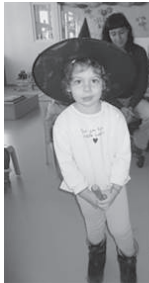
Ich bin die kleine Hexe...