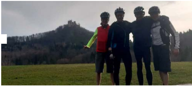
Kurze Bildpause am "Bollemmer Wasen"

Basic-Infos zu diesen Touren: Im Umkreis Rangendingen, Starzeltal, Eyachtal, Zoller, Neckartal, Raichberg/Albtrauf. Dauer ca. 2,5 - 3 Stunden