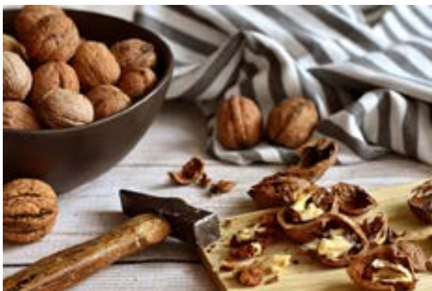
Bild: Wilde Walnüsse

Walnüsse sind selten und sehr beliebt in den Streuobstwiesen – nicht nur bei den Besitzern!