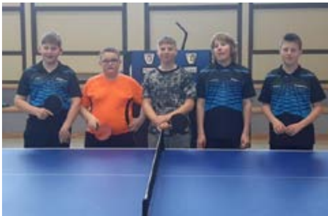
Die 1. Jugendmannschaft des TTC Rangendingen.

Die 1. Jugendmannschaft erspielte sich in der Vorrunde 2022 auf Anhieb mit 12:6 Punkten einen Aufstiegsplatz in der Bezirksklasse Jungen und spielte somit in der Rückrunde eine Klasse höher in der Bezirksliga. Dies allein war schon ein beachtlicher Erfolg für die noch nicht lange spielenden Jugendlichen. In der deutlich stärkeren Liga konnten von 10 ausgetragenen Partien immerhin 3 gewonnen werden, was in der 11er Gruppe den 9 Tabellenplatz ausmachte.