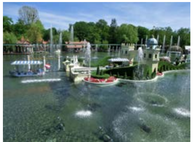
Auf geht's zu Josefinas Zauberreise