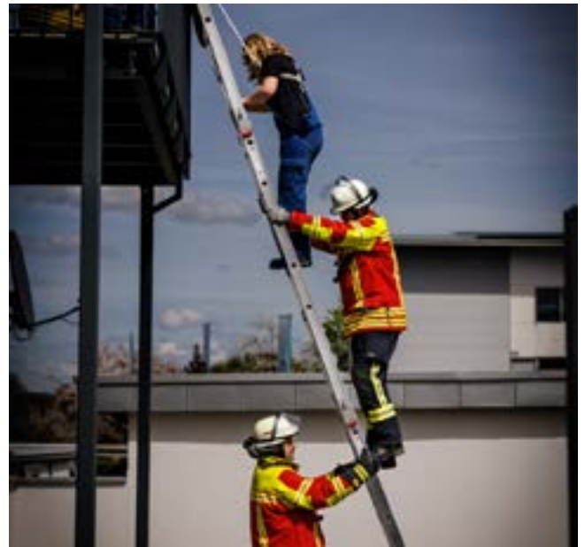
Menschenrettung über Leitern

Die Verletztendarsteller wurden von der Jugendfeuerwehr und von den Löschzwergen gestellt. Diese wurden von ihren großen FeuerwehrkameradInnen über Leitern und durch ein Nebengebäude gerettet.