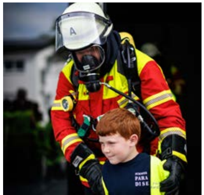
Rettung mit Atemschutz