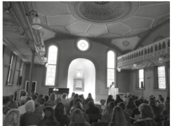
Elie Wiesels „Die Nacht“ wurde von Schülerinnen und Schülern des BSZ in der Synagoge am Stück gelesen